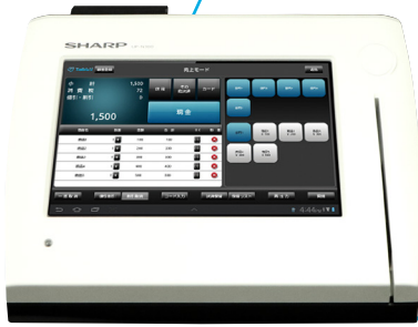
一体型レジ端末 Tabレジ for UP-N300