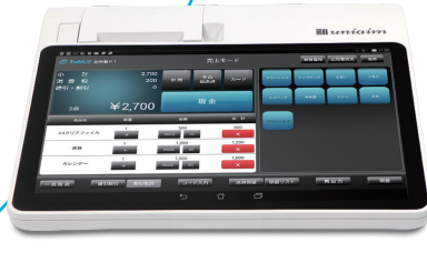
一体型レジ端末 Tabレジ