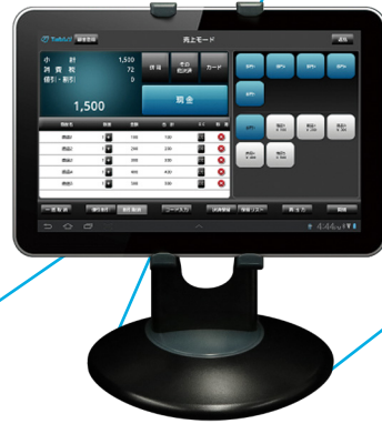
Tabレジ for Tablet