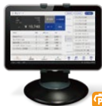
Tabレジ for Tablet

静電気式タッチパネルディスプレイを採用したフラットなシルエット。今までになかった軽量感を実現しました。