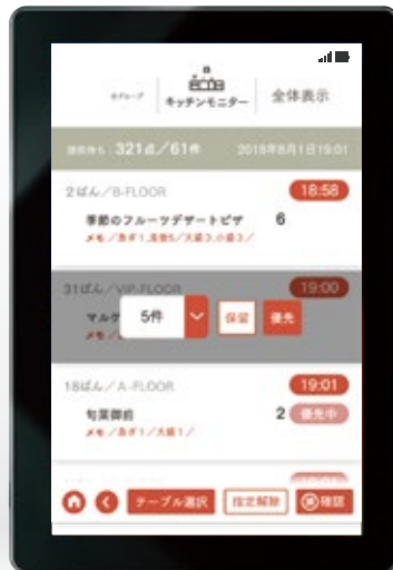
キッチン・パントリーモニター

簡単操作でのオーダー入力はもちろん、テーブル移動などのテーブル管理も楽々操作。オーダー状況もリアルタイムに把握することが可能です。