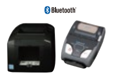
レシートプリンター

Tabレジ for Tablet からのレシートを高速度印刷。印刷は熱転方式になります。