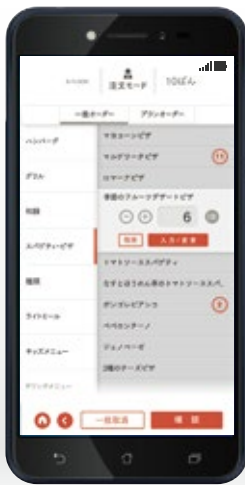
オーダーハンディ

Tabレジのアカウント作成、機器の納入まで約2週間程度が目安となります。お急ぎの場合は事前にご相談下さい。