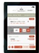
Tabレジ EATS モニター [ Android タブレット ]

片手サイズのスマートフォンです。フロアでのスムーズな注文の受注が可能となります。